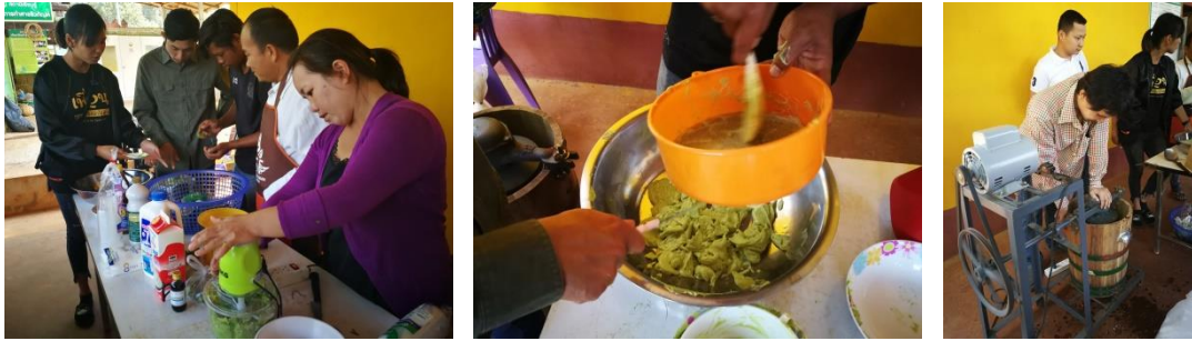
คำอธิบายภาพ..การอบรมเพิ่มมูลค่าให้กับอะโวคาโด (ไอศกรีมอะโวคาโด)

๖) ศูนย์เรียนรู้การเพิ่มประสิทธิภาพการผลิตสินค้าเกษตร (ศพก.) อำเภอพบพระ เป็นจุดเรียนรู้ แหล่งเรียนรู้สำหรับเกษตรกร สมาชิกแปลงใหญ่ และผู้สนใจทั่วไป ถ่ายทอดความรู้เกี่ยวกับอะโวคาโดทุกระบวน