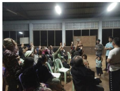
คำอธิบายภาพ..ได้รับเชิญให้เป็นวิทยากรบรรยายโครงการหมู่บ้านเข้มแข็งคู่ขนานตามแนวชายแดนและร่วมประชุมประจำเดือนของหมู่บ้านนอกเวลาราชการ