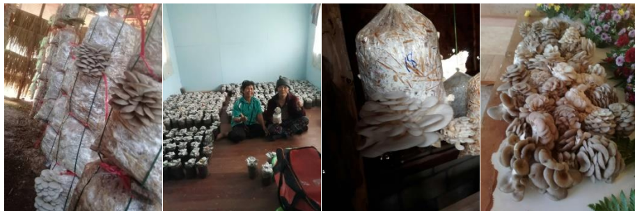
คำอธิบายภาพ..การใช้ฟางข้าวไร่ในพื้นที่มาเพาะเห็ดนางฟ้าโดยไม่ใช้สารเคมี

๓) เกิดนวัตกรรมใหม่โดยการนำเศษวัสดุเหลือใช้จากการทำข้าวไร่ไปเพาะเห็ดนางฟ้า โดยเป็นการเพาะเห็ด นางฟ้าแบบอินทรีย์ และนำปัจจัยการผลิตที่ได้รับไปต่อยอดให้เกิดอาชีพ และตลาดมีความต้องการเห็ดนางฟ้าจาก ฟางข้าวจำนวนไม่ต่ำกว่า ๓๐ กิโลกรัมต่อวัน สามารถสร้างรายได้วันละไม่ต่ำกว่า ๒,๐๐๐ บาท