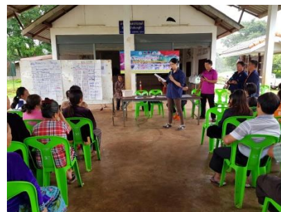
คำอธิบายภาพ..ร่วมบูรณาการกับหน่วยงานอื่นๆ ออกพื้นที่เพื่อจัดทำเวทีชุมชน