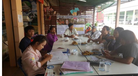
คำอธิบายภาพ..การจัดตั้งกลุ่มวิสาหกิจชุมชนแปรรูปเกษตรปลอดภัย บอร์ดอร์ออร์แกนิกส์

๒) เกษตรกรปรับเปลี่ยนพฤติกรรมแบบเชิงเดี่ยวเป็นการทำการเกษตรแบบผสมผสาน ลดการใช้สารเคมี ซึ่งได้ ปฏิบัติตามเงื่อนไข GAP และสามารถต่อยอดให้เป็นการเกษตรแบบวิถีเกษตรอินทรีย์