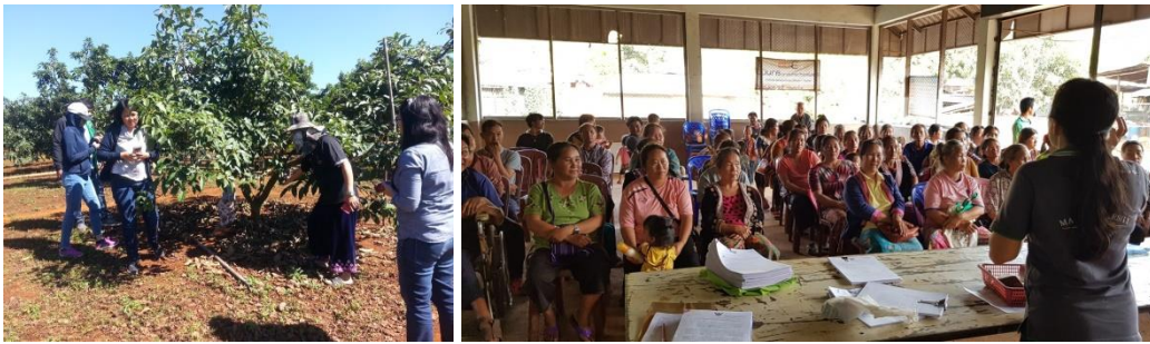
คำอธิบายภาพ..การจัดเวทีชุมชนและสำรวจข้อมูล

๑) จัดทำแผนการส่งเสริมการเกษตรแบบแปลงใหญ่ (อะโวคาโด) เพื่อผลิตสินค้าเกษตรที่ได้คุณภาพและมาตรฐานตามความต้องการของผู้บริโภค และจัดวิชาตามความต้องการของเกษตรกร