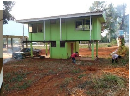
คำอธิบายภาพ..การปรับปรุงบ้านพักเกษตรกรตำบลในพื้นที่ และทำบุญบ้านพักเกษตรกรตำบล

๓) ใช้วัสดุ อุปกรณ์และสาธารณูปโภคได้อย่างประหยัดและเหมาะสม เช่น นำกระดาษที่ใช้แล้วนำมาเย็บเล่มเพื่อทำเป็นสมุดโน้ต และนำป้ายอบรมโครงการที่เหมือนกันของงบประมาณที่ผ่านมา ปรับปรุงให้เป็นปัจจุบัน เพื่อลดงบประมาณการจัดทำป้ายโครงการใหม่