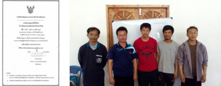
คำอธิบายภาพ..การดำเนินการจัดตั้งวิสาหกิจชุมชนกลุ่มผักปลอดภัยแปลงใหญ่