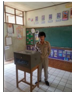
คำอธิบายภาพ..เป็นกรรมการเลือกตั้งผู้ใหญ่บ้าน และร่วมงานพระราชพิธีทุกครั้งอย่างเคร่งครัด

๓) เป็นผู้ตรงต่อเวลา การดำเนินบ้างอย่างถ้าล่าช้า อาจจะส่งผลเสียตามมาไม่มากนัก ถ้าผิดเวลาจะทำให้หมดความน่าเชื่อถือ จึงต้องถือปฏิบัติให้เป็นผู้ที่ตรงต่อเวลาหรือมาก่อนเวลา