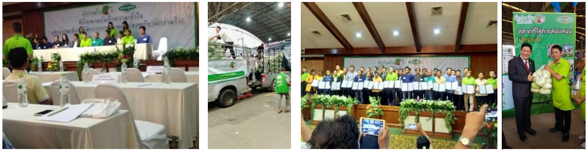
คำอธิบายภาพ..การร่วมนำผลผลิตที่ได้รับมาตรฐาน Thai GAP ไปจำหน่ายที่ตลาดไท

๕) หน่วยงานบูรณาการใช้ศูนย์เรียนรู้การเพิ่มประสิทธิภาพการผลิตสินค้าเกษตร (ศพก.) เป็นจุดถ่ายทอดความรู้ นำปัจจัยการผลิตเพื่อสนับสนุนเกษตรกร สามารถลดต้นทุนการผลิต จาก ๒๕,๖๐๐ บาท/ไร่ เป็น ๒๓,๒๐๐ บาท/ไร่ ผลผลิตเพิ่มจาก ๖-๘ ตัน/ไร่ เป็น ๘-๑๐ ตัน/ไร่ มีมูลค่าการจำหน่ายกว่า ๖,๐๐๐,๐๐๐ บาท/ปี