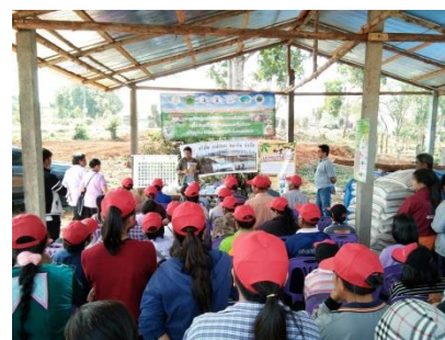
คำอธิบายภาพ..การจัดทำโครงการขับเคลื่อนปรัชญาเศรษฐกิจพอเพียงในชุมชน

๓) เกษตรกรได้นำองค์ความรู้ที่ได้ และนำปัจจัยการผลิตที่ได้รับไปต่อยอดให้เกิดอาชีพ