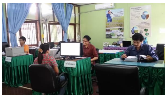
คำอธิบายภาพ..ติดตั้งเครื่องกระจายเสียงภายในสำนักงานเพื่ออำนวยความสะดวกการให้บริการเกษตรกร