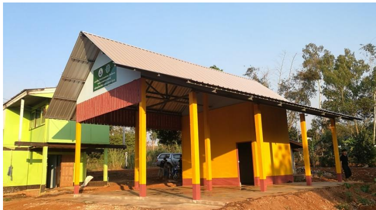
คำอธิบายภาพ..ศูนย์เรียนรู้การเพิ่มประสิทธิภาพการผลิตสินค้าเกษตร (ศพก.) อำเภอพบพระ จังหวัดตาก

ศูนย์บริการและถ่ายทอดเทคโนโลยีการเกษตรประจำตำบล (ศบกด.) และศูนย์เรียนรู้การเพิ่มประสิทธิภาพการผลิตสินค้าเกษตร (ศพก.) เป็นแหล่งเรียนรู้ ถ่ายทอดความรู้ และศึกษาดูงาน ทำให้มีเกษตรกรสนใจเข้ามาศึกษาหาความรู้เพื่อนำองค์ความรู้ที่ได้จาก ศพก. และ ศบกด. ไปปรับใช้ในการทำการเกษตรของตนเอง ซึ่งทางสำนักงานเกษตรอำเภอพบพระ และองค์การบริหารส่วนตำบลคีรีราษฎร์ ได้มุ่งเน้นการทำเกษตรตามแนวทางปรัชญาเศรษฐกิจพอเพียงในชุมชน และให้เกษตรกรเกิดการเรียนรู้ในการพึ่งพาตนเอง มีการดำเนินชีวิตให้อยู่อย่างพอประมาณตน เดินทางสายกลาง มีความพอดีและพอเพียงกับตนเอง ครอบครัวและชุมชน โดยไม่ต้องพึ่งพาปัจจัยภายนอกต่างๆ มีการส่งเสริมให้ใช้พื้นที่ว่างเปล่าในบริเวณบ้าน รั้วรอบบ้าน ปลูกพืชผักสวนครัวและสมุนไพร เครื่องเทศ และพืชล้มลุกต่างๆ ไม้บริโภค สำนักงานเกษตรอำเภอพบพระจึงได้จัดเวทีชุมชนร่วมกับเกษตรกรในพื้นที่ตำบลคีรีราษฎร์เพื่อจัดทำแผนพัฒนาการเกษตรระดับตำบล เพื่อเสนอความต้องการให้องค์การบริหารส่วนตำบลคีรีราษฎร์สนับสนุนงบประมาณ เพื่อจัดทำโครงการและกิจกรรมตามความต้องการของเกษตรกรในพื้นที่ โดยให้ศูนย์บริการและถ่ายทอดเทคโนโลยีการเกษตรประจำตำบล (ศบกด.) และศูนย์เรียนรู้การเพิ่มประสิทธิภาพการผลิตสินค้าเกษตร (ศพก.) เป็นจุดขับเคลื่อนและเป็นจุดศูนย์รวมของดำเนินงานหน่วยงานภาคีต่างๆที่ได้มาบูรณาการให้เกิดประโยชน์สูงสุดแก่เกษตรกรสนใจเข้าร่วม