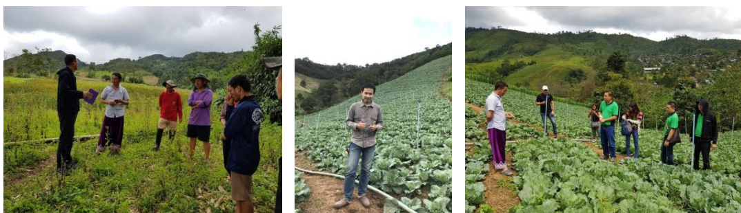
คำอธิบายภาพ..การจัดทำแปลงทดลองกับบริษัทเอกชนเพื่อพัฒนาผลผลิตสู่การทำเกษตรแบบอินทรีย์

๒) พัฒนาแปลงเรียนรู้ให้เป็นแปลงทดลองโดยร่วมบริษัทเอกชนเพื่อ ทดลองการลดให้สารเคมีตามแนววิถีเกษตรอินทรีย์