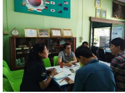
คำอธิบายภาพ..เปิดใจยอมรับฟังแนวคิด และให้โอกาสทีมงานเสนอแนวการทำงาน