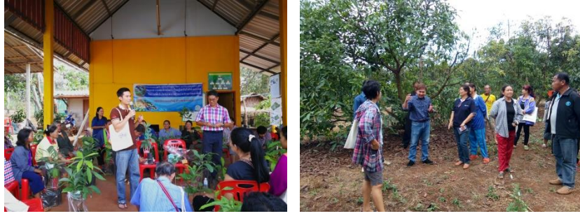
คำอธิบายภาพ..การจัดอบรมให้ความเกษตรกรผู้ปลูกอะโวคาโด