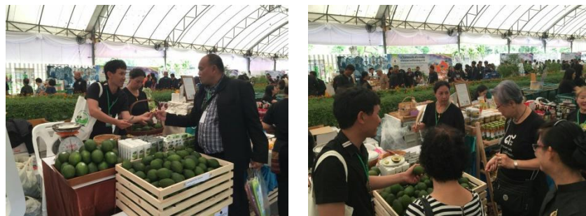
คำอธิบายภาพ..นำเกษตรกรแปลงใหญ่อะโวคาโดมาจำหน่ายสินค้างานเกษตรไทยก้าวหน้าภายใต้ร่มพระบารมี ที่ สวนลุมพินี

๒) การสร้างมูลค่าจากการส่งเสริมพืชที่มีอัตลักษณ์เฉพาะถิ่นของอำเภอพบพระ