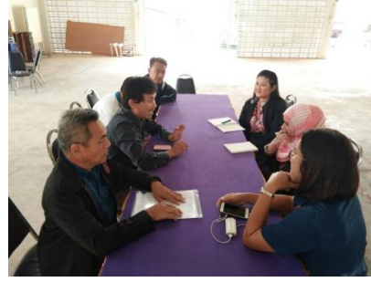
คำอธิบายภาพ..การประชุมทำความเข้าใจกับทีมงานเพื่อทำความเข้าใจการจัดโครงการเพื่อเสนอในแผนของ อบท.

๒) รวบรวมข้อมูลต่างๆเช่น แผนพัฒนาการเกษตร ข้อมูลการทำกรเกษตร ข้อมูลจากการจัดเวที เป็นต้น กำหนดความต้องการและความสำคัญ แล้วจึงจัดทำแผนพัฒนาการเกษตรฉบับสมบูรณ์