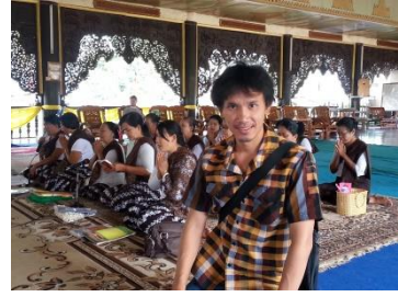
คำอธิบายภาพ..สวดมนต์ข้ามปีที่วัดใกล้บ้านเป็นประจำทุกๆปี และไหว้พระตามวัดต่างๆในวันหยุด

๗) ดำเนินชีวิตตามหลักพุทธธรรมคำสอนทางพุทธศาสนา รักษาศีล ทำบุญทำทาน เข้าวัด เพื่อทำจิตใจให้สงบ เพื่อพร้อมกับการทำงาน ควบคุมอารมณ์ให้นิ่ง