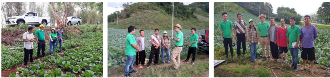
คำอธิบายภาพ...การประชุมเพื่อหารือ เสนอสินค้า ปรีกษาถึงความเป็นไปได้ของการซื้อขายระหว่างเกษตรกรและตลาดไท

บริษัท ฟู้ดแพชชั่น จำกัด (บาร์บิคิว พลาซ่า) ประสานสำนักงานเกษตรจังหวัดตาก เสนอความต้องการรับซื้อผลผลิตกะหล่ำปลีจากสมาชิกแปลงใหญ่กะหล่ำปลี สำนักงานเกษตรจังหวัดตากจึงได้ประสานสำนักงานเกษตรอำเภอพบพระและสำนักงานเกษตรอำเภออุ้มผางเพื่อประสานสมาชิกแปลงใหญ่กะหล่ำปลีที่จะเข้าพื้นที่ชี้แจงเงื่อนไขข้อตกลง ศึกษาความพร้อมของสมาชิก ซึ่งสมาชิกแปลงใหญ่กะหล่ำปลีในพื้นที่อำเภอพบพระมีความพร้อมที่จะทำตามเงื่อนไข ข้อตกลง แต่ด้วยสมาชิกไม่มีใบรับรองมาตรฐาน GAP เพื่อสร้างความมั่นใจให้แก่บริษัทและเพื่อเป็นผลประโยชน์ต่อเกษตรกร สำนักงานเกษตรอำเภอพบพระได้ทำการทดสอบสารตกค้างเบื้องต้นในผลผลิตเมื่อไม่พบสารตกค้างที่เกินค่ามาตรฐานจึงทำหนังสือรับรองความปลอดภัยของผลผลิต เมื่อบริษัทเกิดความมั่นใจในผลผลิตแล้วสมาชิกจึงได้เดินทางไปลงนามในสัญญาซื้อขายกับบริษัท โดยมีตัวแทนสำนักงานเกษตรอำเภอพบพระเป็นพยานในการทำสัญญาในครั้งนี้