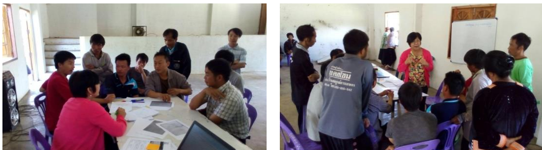
คำอธิบายภาพ...ดำเนินการขอรับรองมาตรฐานระบบการผลิตสินค้าเกษตรที่มีความปลอดภัยของภาคเอกชน (Thai GAP)

บริษัท ฟู้ดแพชชั่น จำกัด (บาร์บิคิว พลาซ่า) ประสานสำนักงานเกษตรจังหวัดตาก เสนอความต้องการรับซื้อผลผลิตกะหล่ำปลีจากสมาชิกแปลงใหญ่กะหล่ำปลี สำนักงานเกษตรจังหวัดตากจึงได้ประสานสำนักงานเกษตรอำเภอพบพระและสำนักงานเกษตรอำเภออุ้มผางเพื่อประสานสมาชิกแปลงใหญ่กะหล่ำปลีที่จะเข้าพื้นที่ชี้แจงเงื่อนไขข้อตกลง ศึกษาความพร้อมของสมาชิก ซึ่งสมาชิกแปลงใหญ่กะหล่ำปลีในพื้นที่อำเภอพบพระมีความพร้อมที่จะทำตามเงื่อนไข ข้อตกลง แต่ด้วยสมาชิกไม่มีใบรับรองมาตรฐาน GAP เพื่อสร้างความมั่นใจให้แก่บริษัทและเพื่อเป็นผลประโยชน์ต่อเกษตรกร สำนักงานเกษตรอำเภอพบพระได้ทำการทดสอบสารตกค้างเบื้องต้นในผลผลิตเมื่อไม่พบสารตกค้างที่เกินค่ามาตรฐานจึงทำหนังสือรับรองความปลอดภัยของผลผลิต เมื่อบริษัทเกิดความมั่นใจในผลผลิตแล้วสมาชิกจึงได้เดินทางไปลงนามในสัญญาซื้อขายกับบริษัท โดยมีตัวแทนสำนักงานเกษตรอำเภอพบพระเป็นพยานในการทำสัญญาในครั้งนี้