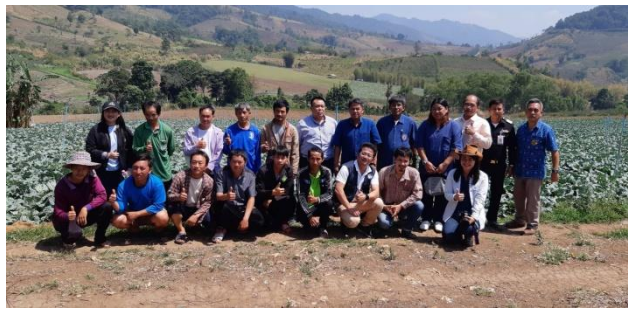
คำอธิบายภาพ..ต้อนรับนายสัตวแพทย์ก้อย สุทธิสังข์ หัวหน้าผู้ตรวจราชการกระทรวงเกษตรและสหกรณ์ พร้อมด้วย นายดิเรก ตนพะยอม ที่ปรึกษาปลัดกระทรวงเกษตรและสหกรณ์ และคณะ ตรวจติดตามแนวทางการดำเนินการผลิตการเกษตรปลอดภัยสินค้าทะเล่าปลี