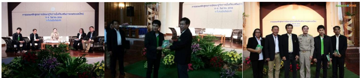
คำอธิบายภาพ..การนำเสนองานแปลงใหญ่ผักปลอดภัย (กะหล่ำปลี) ณ โรงแรมเชียงใหม่ ออร์คิด เรื่องการอบรมหลักสูตรการพัฒนาผู้จัดการพื้นที่ส่งเสริมการเกษตรแปลงใหญ่