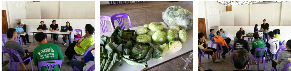
คำอธิบายภาพ...การประชุมเพื่อหารือ เสนอสินค้า ปรีกษาถึงความเป็นไปได้ของการซื้อขายระหว่างเกษตรกร และบริษัท ฟู้ดแพชชั่น จำกัด (บาร์บิคิว พลาซ่า)

ถ่ายทอดเทคโนโลยีการผลิตทางการเกษตรที่มีประสิทธิภาพ ส่งเสริม พัฒนา ให้บริการ และดูแลเกษตรกรในพื้นที่ให้เกิดผลสำเร็จอย่างเป็นรูปธรรม รวมทั้งบูรณาการและสร้างความเป็นเอกภาพในการดำเนินการ ศพก. ร่วมกันของหน่วยงานต่างๆ ที่เกี่ยวข้อง