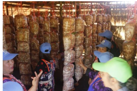
คำอธิบายภาพ..เกษตรกรให้ความสนใจที่จะเข้ามาเรียนรู้ในแปลงเรียนรู้เกษตรผสมผสานตามปรัชญาเศรษฐกิจพอเพียง