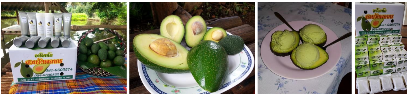
คำอธิบายภาพ..การส่งเสริมให้อะโวคาโดเป็นพืชที่มีอัตลักษณ์เฉพาะถิ่นของอำเภอพบพระ ซึ่งพัฒนาแปรรูปเพื่อเพิ่มมูลค่า

๓) เกิดการพัฒนาการผลิต และต่อยอดให้กับผู้ที่ได้รับรางวัลให้แปลงเรียนรู้ เพื่อเป็นแหล่งเรียนรู้และศึกษาดูงานแก่ผู้สนใจ