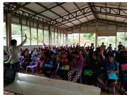
คำอธิบายภาพ..การจัดทำเวทีชุมชนเพื่อเสนอโครงการ โดยเป็นโครงการที่เป็นความต้องการของชุมชน