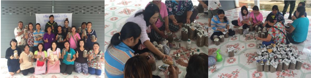
คำอธิบายภาพ..การอบรมเผยแพร่ความรู้ให้แก่เกษตรกรที่สนใจ

๑) เกษตรกรและประชาชนในพื้นที่อำเภอบพพระ มีการใช้ชีวิตประจำวันตามหลักการของความพอเพียง ความพอดี การใช้ชีวิตอย่างรอบคอบ ไม่ฟุ่มเฟือย ใช้ชีวิตในความไม่ประมาท ใช้ทรัพยากรที่มีอยู่ให้เกิดประโยชน์ มีคุณค่า เกิดรายได้