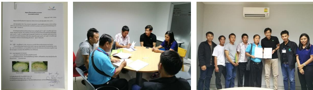
คำอธิบายภาพ..การทำสัญญาซื้อขาย Contact farming กับ บริษัท ฟู้ดแพชชั่น จำกัด (บาร์บีคิว พลาซ่า)