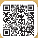
ตัวอย่าง หนังสือขอพระราชทาน