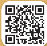
แบบสำนึก ในพระมหากรุณาธิคุณ